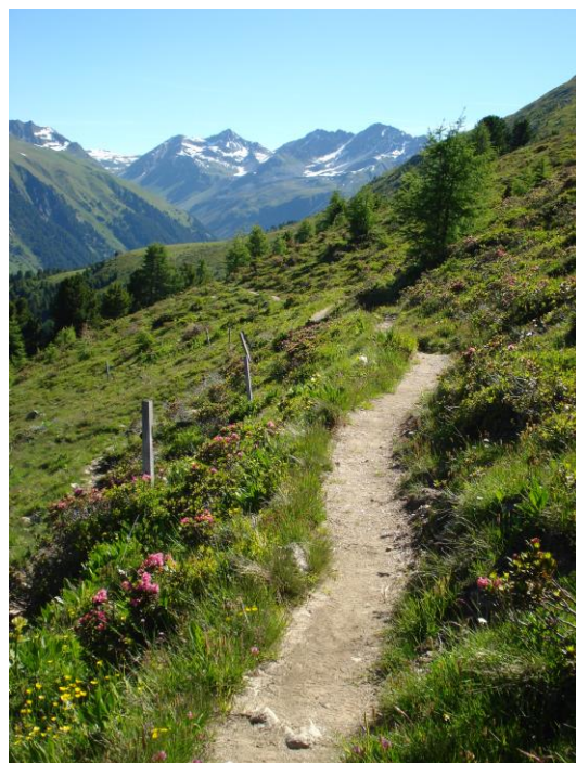
am 1. Tag zuerst höhenweg-ähnlich